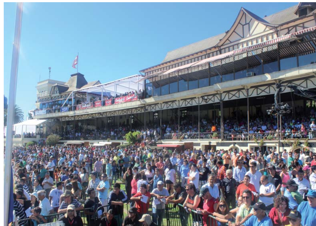
Más de 100.000 personas coparon las dependencias del Valparaíso Sporting Club el Derby Day

Solaria preparada por Juan Pablo Baeza y luciendo los colores del stud Vendaval, impuso el nuevo récord de 2.23.34 en los 2.400 metros de la pista de césped, sumando 7 primeros, 2 segundos y una tercera ubicación en 10 presentaciones, al momento clasifica para representar al Sporting Club en el gran premio Latinoamericano, pero serán sus artífices los que decidan su participación, como se dio a conocer en la rueda de prensa posterior al sensacional evento clásico.